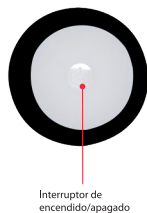
Interruptor de encendido/apagado