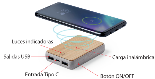
6736_POWER BANK GORIX