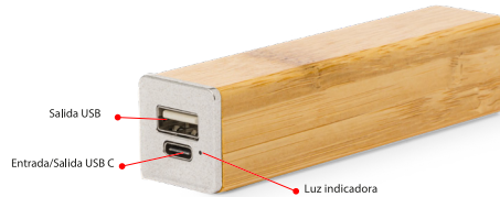
ITEM 20844 - Power Bank Godimer